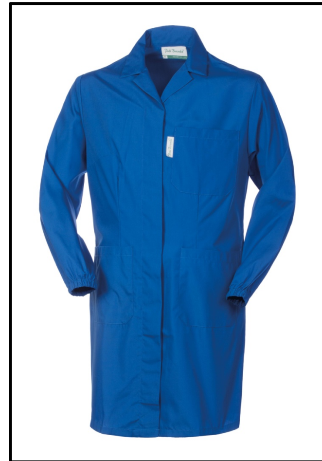
06 – AZZURRO ROYAL