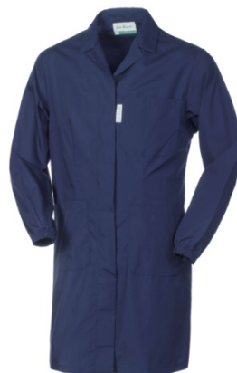
01 – BLU

Due tasche e un taschino applicati, schiena intera, martingala posteriore cucita, elastico ai polsi.