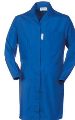
06 – AZZURRO ROYAL