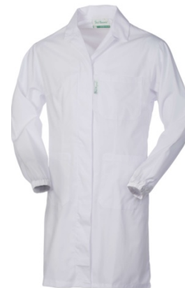
02 – BIANCO